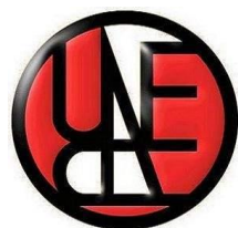
Unión Nacional de Escritores y Artistas de Cuba