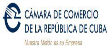
Delegación de la Cámara de Comercio Santiago de Cuba