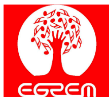
Empresa de Grabaciones y Ediciones Musicales Egrem